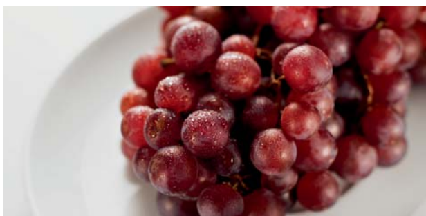
Черный виноград особенно богат биофлавоноидами, необходимыми для защиты сердца и сосудов.

В наши дни очень многие ученые обращают особое пристальное внимание на витамины и микро-элементы,